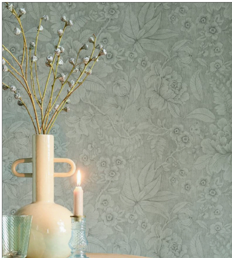
Helle Farben öffnen Weite im Raum. [Eiffinger/Sefra]

fra: „Bei der Auswahl von Tapeten sollten wir daher nicht nur das Design berücksichtigen, sondern auch darüber nachdenken, wie die Farben, Muster und Texturen unser tägliches Leben beeinflussen können.“