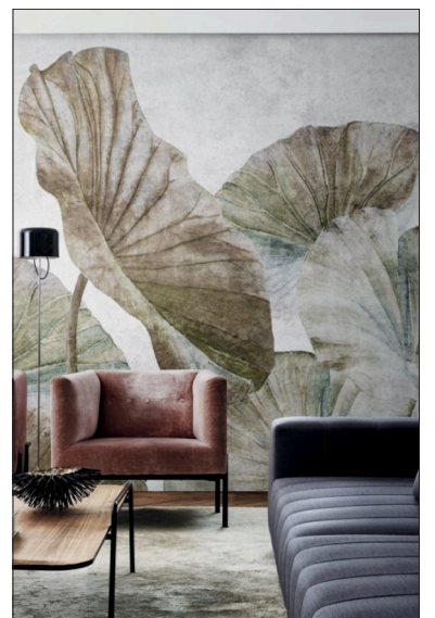
Bei Tapeten entscheidet die Wahl des Musters. [London Arts/Sefra]