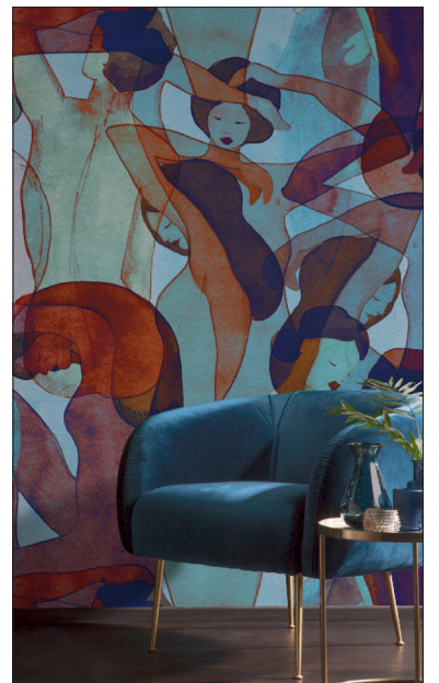
Ein Muster an der Wand kann auch beleben.

schmelzen können, um eine einzigartige Atmosphäre zu schaffen, die Ihre Persönlichkeit widerspiegelt. Gönnen Sie sich das Beste für Ihre Wohn- oder Arbeitsräume und erleben Sie, wie diese Produkte Ihr Zuhause in eine Oase der Schönheit und Eleganz verwandeln können.