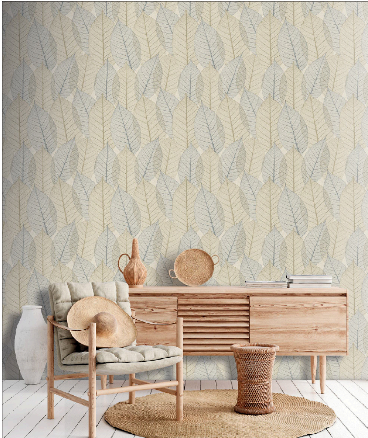
Wärme und Geborgenheit lassen sich vermitteln.

Auf den Punkt gebracht, heißt das: Tapeten spielen eine wesentliche Rolle, um unser Wohlbefinden zu steigern. Gleichzeitig sind sie eine relativ einfache Möglichkeit, die ästhetische Anziehungskraft eines Raumes zu erhöhen, „um eine Umgebung zu schaffen, die unsere Stimmung hebt und damit zur Gesundheit unseres Geistes beiträgt“, sagt Prok. Helmut Peschke von Se-