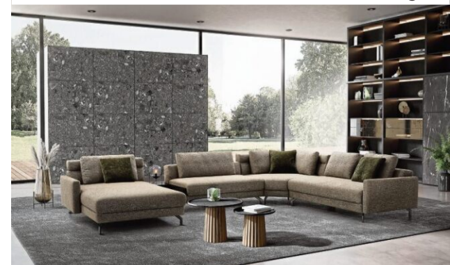
„Novara“ von ADA: Kombi aus Flexibilität und Design