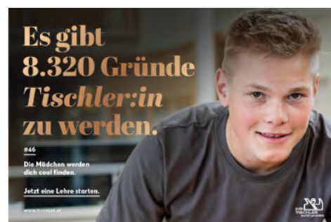
14 Sujet 1