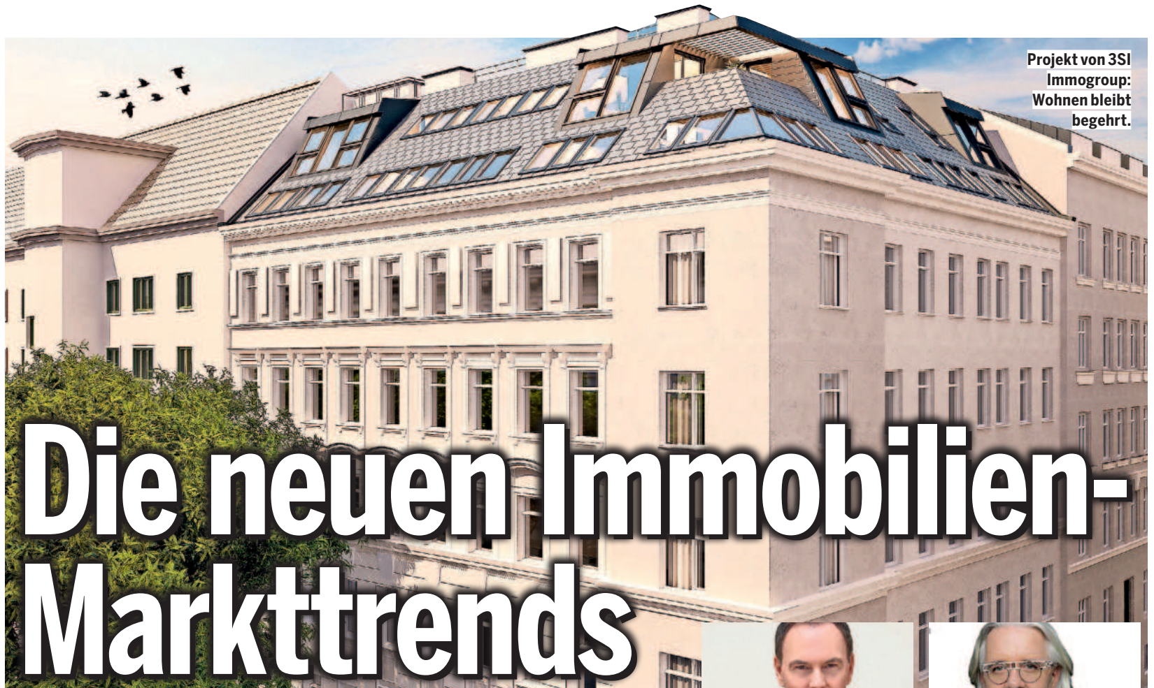
Projekt von 3SI Immogroup: Wohnen bleibt begehr.