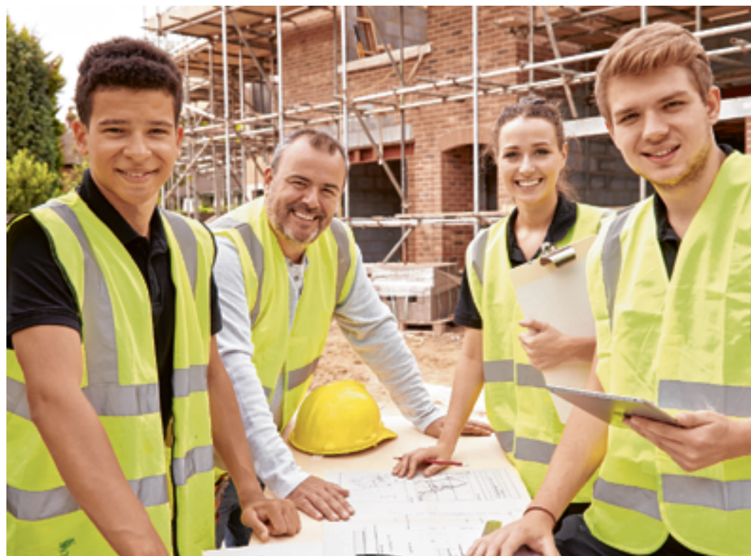
Die Tiroler Baubranche bietet jungen Menschen Top-Perspektiven mit Aufstiegsmöglichkeiten bis ganz nach oben.

Die Tiroler Bauunternehmen suchen laufend nach motivierten Teamplayern. Auch für Schnuppertage stehen dir die Türen der Betriebe jederzeit offen. Und auf dem Jobportal www.jobsambau.at findest du mit nur wenigen Klicks die passende Lehrstelle in deiner Nähe.