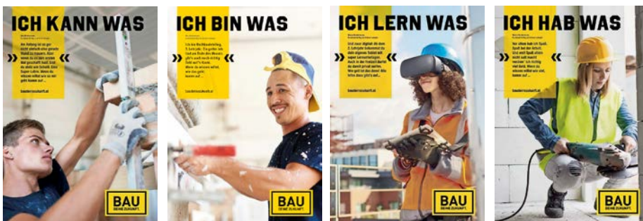
Die Lehrlings-Porträts werden integraler Bestandteil der Webseite www.baudeinezukunft.at und dienen als „Landing-Page“ für die Kampagne.