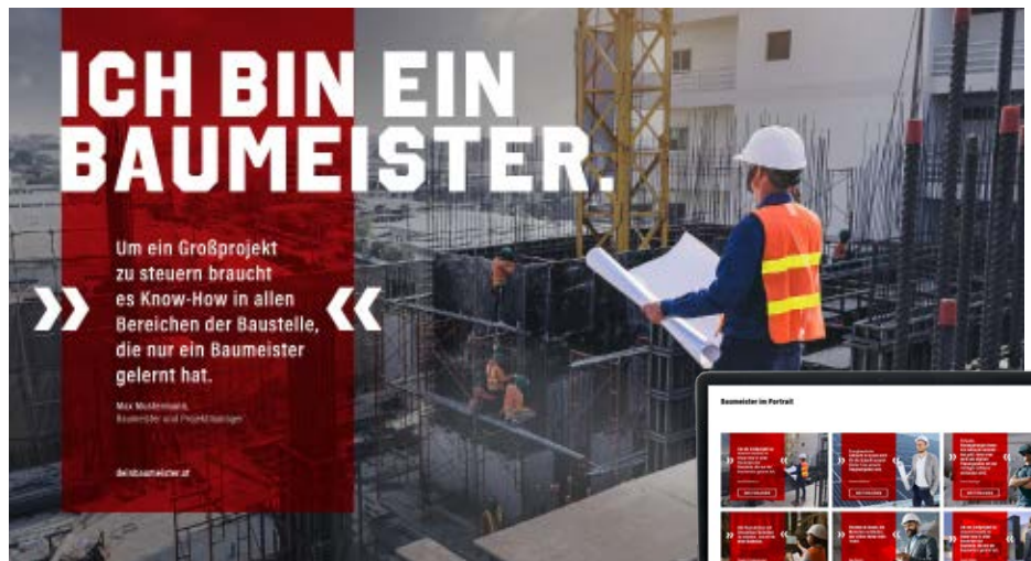
Unter dem neuen Kampagnen-Slogan „Ich bin ein Baumeister“ wird ab 2021 das umfassende Dienstleistungspotential der österreichischen Baumeister kommuniziert.

Ein ähnlicher Ansatz kommt auch bei der neuen Lehrlingskampagne zum Tragen. Um die junge Generation (und ihre Eltern) für eine Baulehre zu begeistern, werden Porträts von echten Baulehrlingen und ihrer Arbeit produziert.