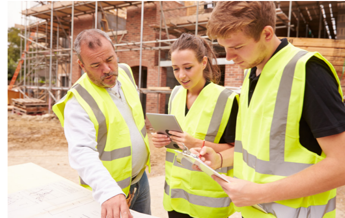
Die Tiroler Baubranche bietet jungen Menschen Top-Perspektiven mit Aufstiegsmöglichkeiten bis ganz nach oben.

Hast du gewusst, dass die Baulehrberufe zu den bestbezahlten Lehrberufen Österreichs gehören?