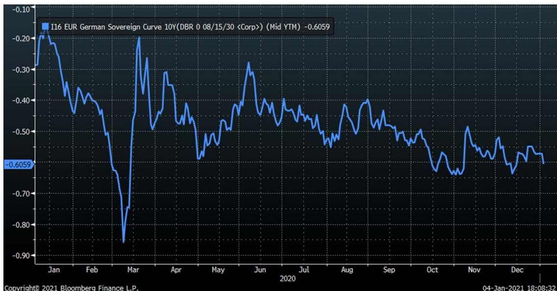
Abbildung 1: Renditen zehnjähriger deutscher Staatsanleihen in 2020

Die Stärke und die Geschwindigkeit der nachfolgenden Kurserholungen besonders an den Aktienmärkten waren für viele Marktteilnehmer eine Überraschung. In den USA erreichten die Leitindizes im Sommer wieder neue Höchststände. In Europa hat man das bis zum Jahresende noch nicht geschafft und geht mit einer negativen Performance von rund minus 2 Prozent seit Jahresbeginn aus dem Rennen. Der österreichische ATX verlor knapp über 10 Prozent in 2020. Im historischen Vergleich waren die Volatilitäten an den Märkten, also die Schwankungsbreiten der Kurse, wesentlich erhöht. Die Umbrüche waren eine Herausforderung für das Veranlagungsrisikomanagement, da viele Investoren durch die zwischenzeitlichen Verluste einfach ausgestoppt wurden und manche an der Erholung deshalb weniger teilhaben konnten.