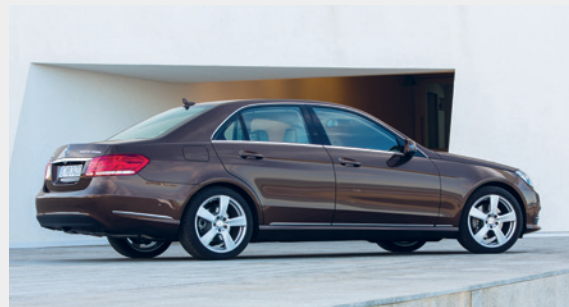
Mercedes-Benz E200 NGD