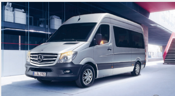
Mercedes-Benz Sprinter Bus NGT