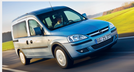
Opel Combo 1.4 CNG ecoFLEX Turbo