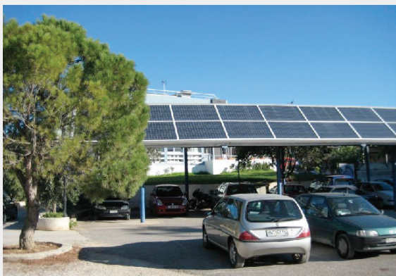
Parkplatz mit PV-Anlage, die auch als Sonnenschutz dient

Elektrofahrzeuge haben einen sehr niedrigen Energieverbrauch von etwa 15–20 kWh pro 100 km.