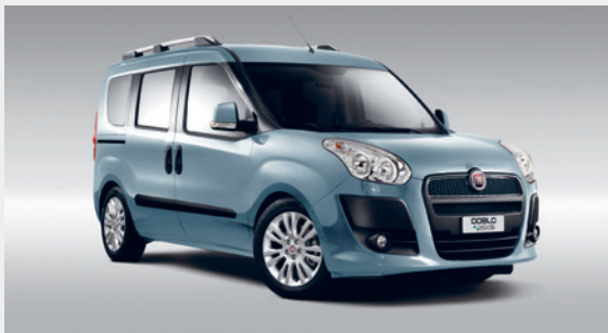
Fiat Doblo Natural Power