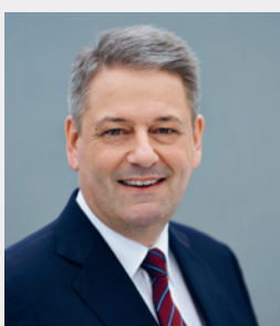
Ihr Andrä Rupprechter Bundesminister für Land- und Forstwirtschaft, Umwelt und Wasserwirtschaft

Für die Fördereinreichung stehen die klima aktiv mobil BeraterInnen kostenfrei zur Verfügung.