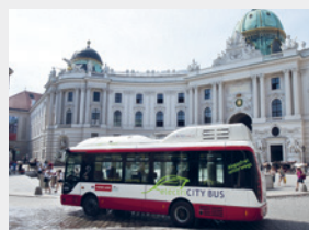
Elektrobus von Siemens/Rampini der Wiener Linien für 30 Personen mit 150 km Reichweite

Am Fahrzeugmarkt sind im Segment der Elektro-Busse derzeit noch hauptsächlich prototypische Fahrzeuge erhältlich. Die Machbarkeit haben bereits die Wiener Linien bewiesen, die im innerstädtischen Verkehr mehrere Elektrobusse im Einsatz haben.