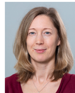
Portrait © HFA/Alice Schnür-Wala