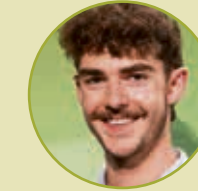
Sieger Elektrotechnik Fabian Winter Pichler GesmbH