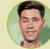
Sieger Hafner Abdullah Ahmadi Kohlroser Kachelöfen GesmbH & Co KG