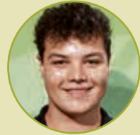
Sieger Bauwerksabdichtungstechnik Jannik Sedlar DFP Hammer GmbH