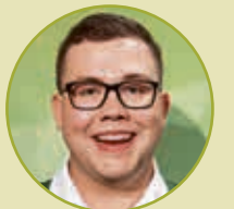
Sieger Spengler Jonas Gaugl Viktor Sajowitz Gesellschaft m.b.H.