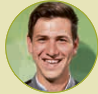
Sieger Holzbau Simon Korpics Konrad Zimmerei GmbH