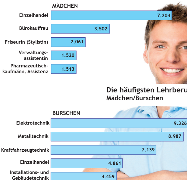
Die häufigsten Lehrberufe 2022 Mädchen/Burschen