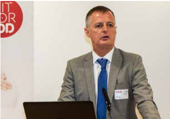
Dr. Ludwig Pflieger

sanktioniert wird. Zusätzlich zum zivilrechtlichen Risiko, kann nun auch die FMA Verwaltungsstrafen verhängen, welche auch veröffentlicht werden. In diesem Zusammenhang warnt Pflieger die versammelten Vertreter und Versicherer, als erste sanktioniert zu werden, denn „gerade zu Beginn werden sich die Medien darauf stürzen.“