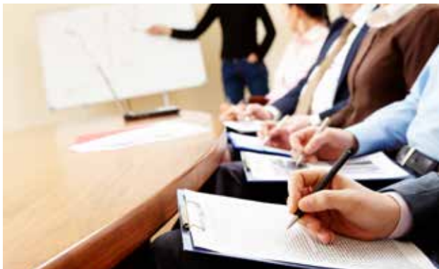
Roadshow des Fachverbandes in Kooperation mit den Fachgruppen – Der Nachbericht