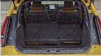
250 Liter, 326 inkl. Fach darunter