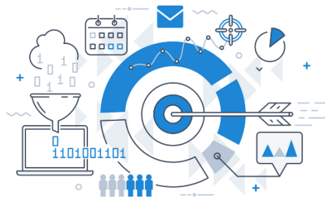
CHART OF THE WEEK