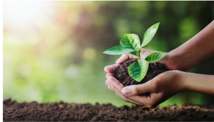
Nachhaltigkeitsservices der WKNÖ