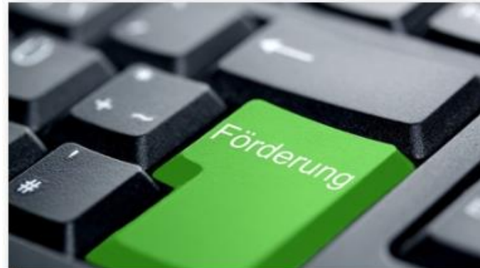
Förderüberblick der WKNÖ