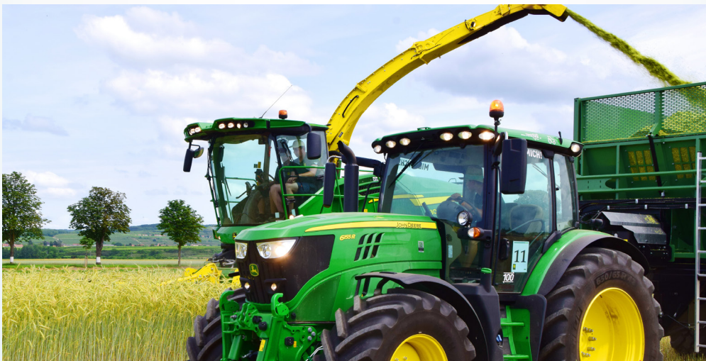
Bild 1: Der Traktor wird sehr oft als „vorhandene Maschine“ bewertet, wo subjektiv nur der Treibstoff als Aufwand gesehen wird.

Die Wirtschaft kennt die drei wichtigsten Produktionsfaktoren, dazu zählen die menschliche Arbeit, der Kapitaleinsatz und die Nutzung von Boden. In diesem Beitrag wollen wir auf die menschliche Arbeit und den Lohn für den Unternehmer näher eingehen.