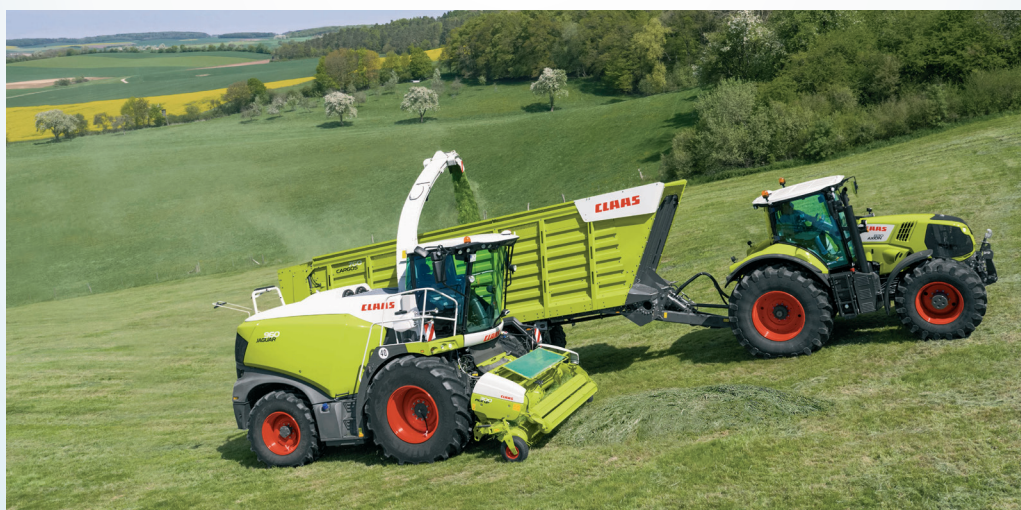
Bild 2: Der Unternehmer braucht für seine Aufgaben und die übernommene Verantwortung einen angemessenen Unternehmerlohn.

FAZIT: Eine höhere Auslastung bei zu niedrigen Preisen (im Bereich von Selbstkosten) führt zu keinem Arbeitsverdienst, weil die variablen Kosten + Nebenkosten aus Nebenzeiten + Unternehmenskosten entsprechend mitwachsen und im Gegenzug die Fixkostendegressionen nicht mehr so wirken. Zudem wird wesentlich mehr Arbeitszeit vom land-/forstwirtschaftlichen Betrieb weggenommen und den Maschinenarbeiten zur Verfügung gestellt, mit dem Ergebnis, dass die Maschinenarbeiten keinen beziehungsweise nur einen sehr geringen Arbeitsverdienst erzielen. Die Investitionen in Ersatzmaschinen sind aufgrund der intensiveren Nutzung (technischen Abschreibung) entsprechend früher zu tätigen. Eine fehlende Arbeitsproduktivität führt zu wirtschaftlichen Problemen, weil die benötigte Personalkapazität für den ursprünglich landwirtschaftlichen Betrieb und eine solide betriebliche Entwicklung nichtmehr zur Verfügung steht.