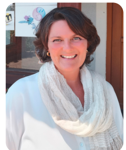
Text und Foto: Sandra Vendel

Seit Oktober 2021 darf ich die Berufsgruppe der Tierbetreuer OÖ im Bundesausschuss vertreten. Ich freue mich auf diese Herausforderung und die Zusammenarbeit mit meinen Kolleginnen und Kollegen.“