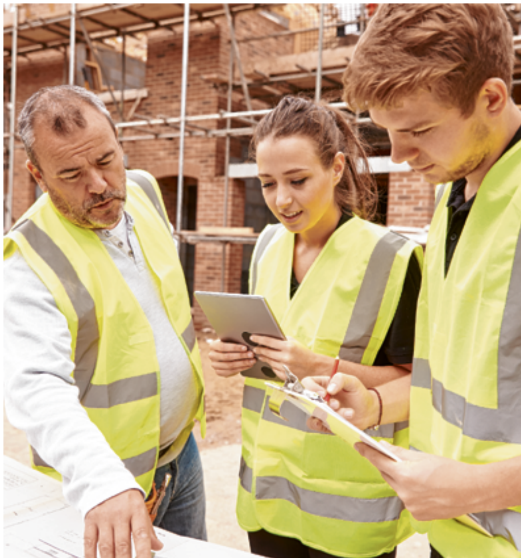
Bereit für den nächsten Karrieresprung? Die BAUakademie Tirol in Innsbruck ist die Aus- und Weiterbildungsstätte der Bauwirtschaft.