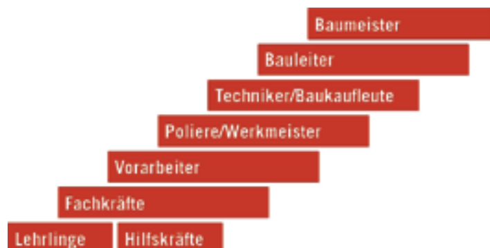
Die Chancen, auf der Karriereleiter nach oben zu steigen, sind in der Baubranche hervorragend. Grafik: BAUakademie Tirol