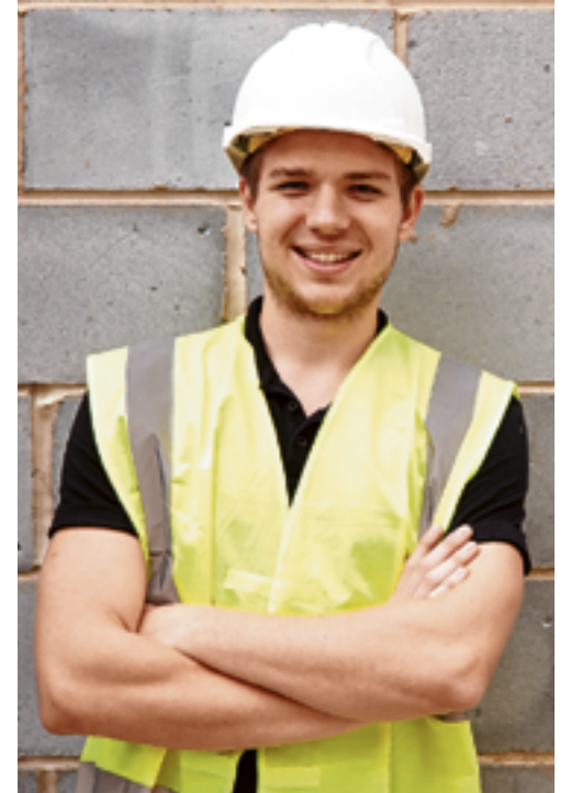
Die vierjährige Kaderlehre beinhaltet eine vertiefte baubetriebswirtschaftliche Ausbildung und einen weiteren technischen Schwerpunkt. Die Baubranche in Tirol bietet jungen Menschen Top-Perspektiven mit Aufstiegsmöglichkeiten bis ganz nach oben. Wer sich für eine Lehre am Bau entscheidet, kann die Karriereleiter stufenweise erklimmen.

Baustelle und werden künftig gleich wichtig sein wie der Umgang mit dem „klassischen Werkzeug“. Entscheidest du dich für eine Lehre am Bau, erhältst du ein kostenloses Tablet, das nicht nur in der Ausbildung, sondern auch in der Praxis zum Einsatz kommt. Mithilfe der vorinstallierten Plattform „E-Baulehre“ kannst du dich ideal auf die Lehrabschlussprüfung vorbereiten.