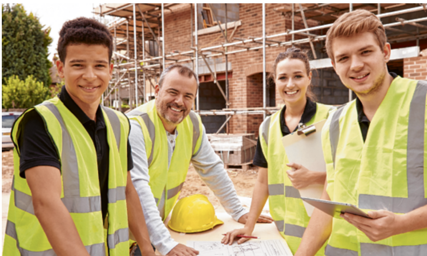
Nach der Lehre am Bau steht dir der Weg bis zum Baumeister offen.