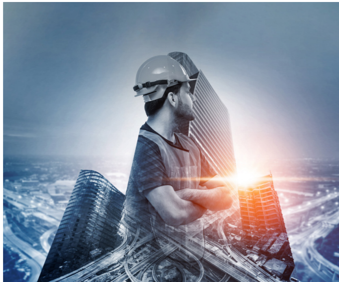
Die Baubranche in Tirol bietet jungen Menschen und Berufsumsteigern Top-Perspektiven und eine überdurchschnittlich gute Bezahlung.

Zugegebenermaßen gibt es noch immer einige Klischees über die Arbeit am Bau, die sich hartnäckig in unseren Köpfen verankert haben: Handwerker brauchen jede Menge Muskeln ... und wenig Hirnzellen. Dort sind auch nur Männer zu finden, die mit einer Flasche Bier in der Hand vorbeigehende Passanten „anbaggern“. Genauso jagen Polizisten den ganzen Tag Bankräuber, während ihnen Spiderman in die Quere kommt und die eigentliche Arbeit übernimmt. In Wahrheit ist das einzige, das von diesem verstaubten Image geblieben ist, der Staub. Ja, den gibt es nach wie vor auf den Baustellen. Und sonst? Am Bau warten zahlreiche und vor allem vielseitige Aufgabenbereiche auf die Macher von morgen. Darüber sind