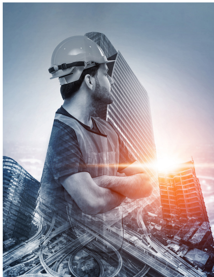
Die Baubranche in Tirol bietet jungen Menschen und Berufsumsteigern Top-Perspektiven mit Aufstiegsmöglichkeiten bis ganz nach oben.