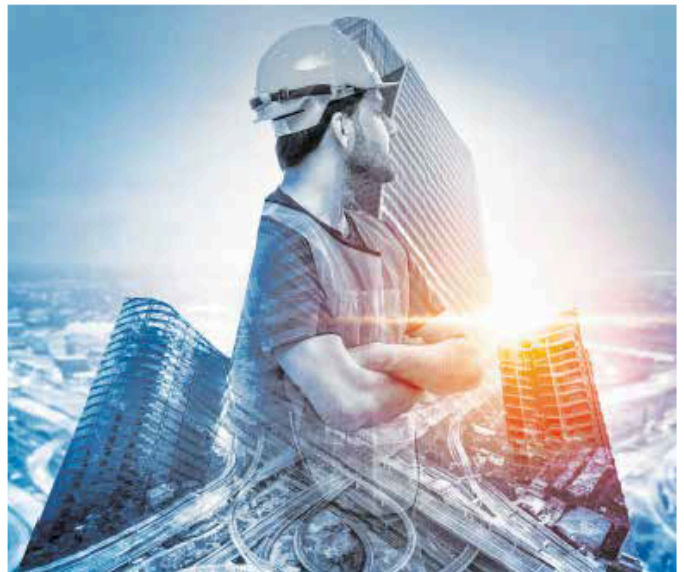
Die Baubranche bietet jungen Menschen und Berufsumsteigern Top-Perspektiven mit Aufstiegsmöglichkeiten.

Bauspezialisten sind gefragt denn je. Mit dem Jobportal www.jobsambau.at findest du rasch, mit nur wenigen Klicks, passende Stellen sowie auch Lehrbetriebe in deiner Nähe.