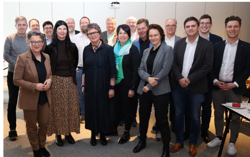
Die Abfalltransporte via Bahn waren bei jeder Fachverbandsausschusssitzung ein zentrales Thema.